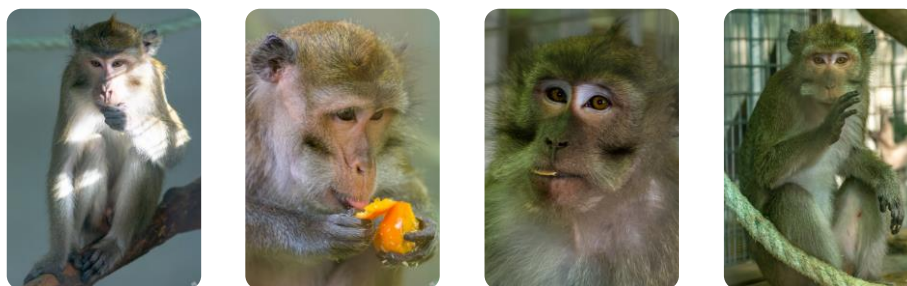
Les quatre macaques crabiers installés dans leurs nouveaux locaux aux Terres de Nataé

Tout récemment, quatre macaques crabiers, espèce répertoriée sur la liste rouge des espèces menacées de l'Union Internationale pour la Conservation de la Nature (UICN), ont quitté leur laboratoire pour rejoindre les Terres de Nataé. Ce partenariat va permettre d'offrir une retraite à de nouveaux primates dans les mois à venir.