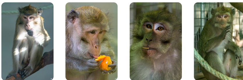
Les quatre macaques crabiers installés dans leurs nouveaux locaux aux Terres de Nataé

Tout récemment, quatre macaques crabiers, espèce répertoriée sur la liste rouge des espèces menacées de l'Union Internationale pour la Conservation de la Nature (UICN), ont quitté leur laboratoire pour rejoindre les Terres de Nataé. Ce partenariat va permettre d'offrir une retraite à de nouveaux primates dans les mois à venir.